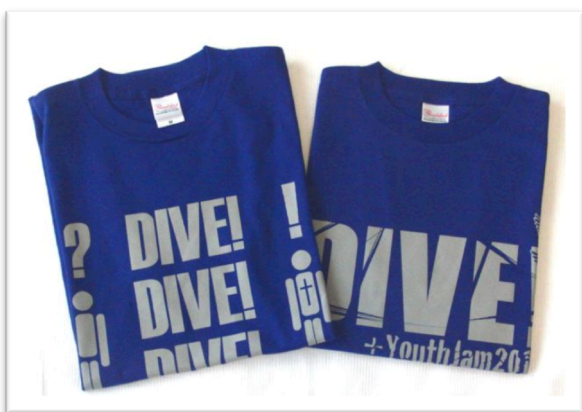
★Japan Blue ジャパンブルー