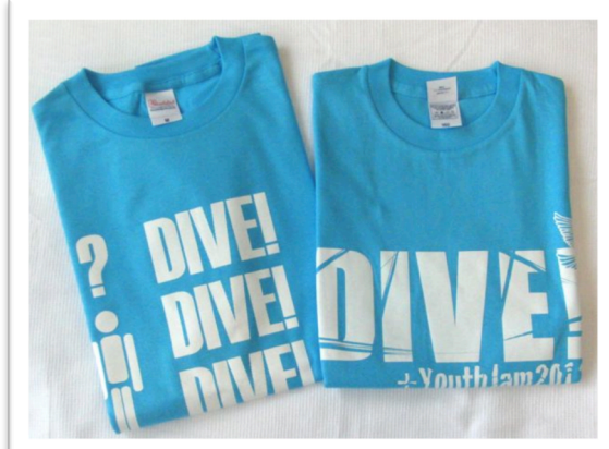
★Sea Blue シーブルー