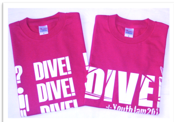
★Hot Pink ホットピンク